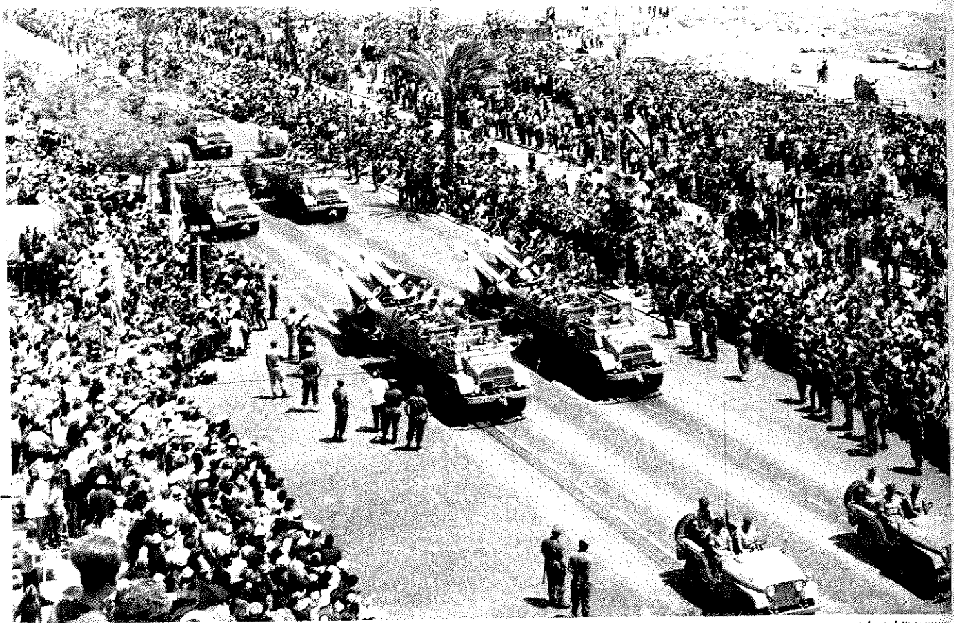
מצעד צה"ל בתל-אביב, 1965. המצעדים ריכוז, מדי שנה, מאות אלפי צופים נלהבים, והועברו בשידור ישיר ברדיו, ואחר כך בטלוויזיה

דווקא בגלל הצורך של הטלוויזיה להגיב על רגשות הצופים באמצעות הפקה ניאו פופוליסטית. מאחר ואלה הם הרגעים בהם הציבור תווד לערוצים הלאומיים, הטלוויזיה מתפשטת אחר שיער לעזאזל שעליו ניתן יהיה להטיל את האשמה, היא מאמצת עמדות פשטניות, מאבדת את ההקשר הפוליטי, ויחד עם זה, מרגיזה חלקים גדולים של הציבור (ליבס, 1998). הכניעה למצב הרוח הפופוליסטי קשורה פחות לשיקולים עתונאיים, או לתמיכות הפוליטיות של העורכים, ויותר ליכולות הטכנולוגיות החדשות, ולדרישות של התחרות המסחרית הקשה שבדרך הטבע משפיעה גם על השידור הציבורי.